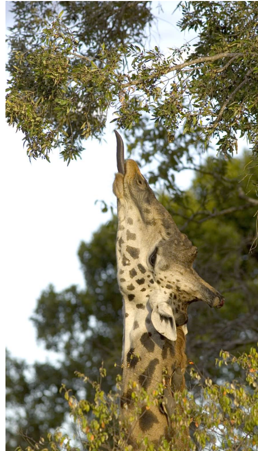
ELLE AURA BEAU ÉTENDRE LE COU au maximum, cette girafe ne le fera pas grandir, contrairement à ce que pensait Lamarck. Le fait que la longueur du cou des girafes varie d'un animal à l'autre est un phénomène purement aléatoire.

⇒ de l'environnement n'y sont pas (ou peu) pris en compte. Et ce, en dépit des travaux du généticien anglais Conrad Waddington et du biologiste soviétique Ivan Schmalhausen, qui apportent pourtant des données en ce sens.