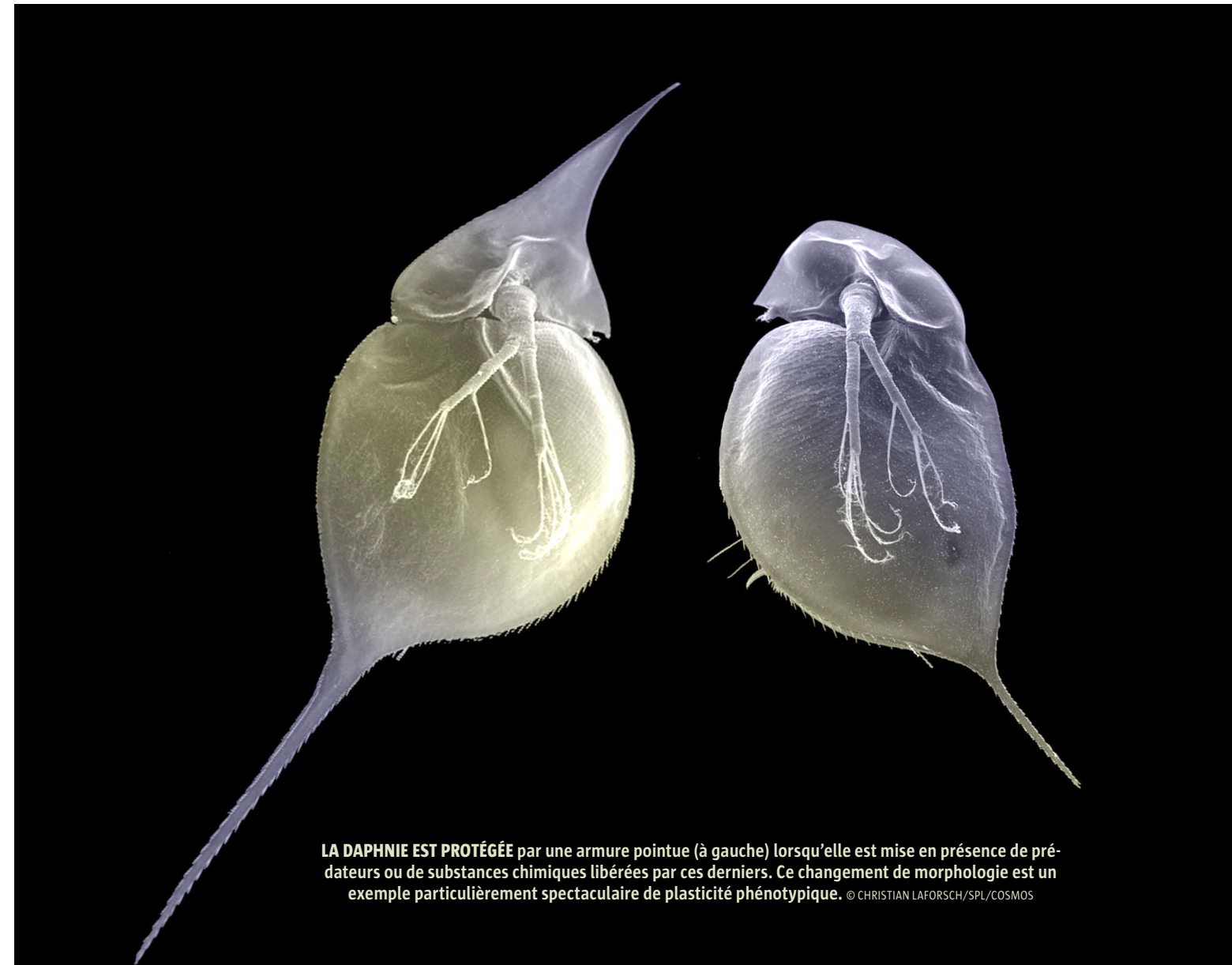
LA DAPHNIE EST PROTÉGÉE par une armure pointue (à gauche) lorsqu'elle est mise en présence de prédateurs ou de substances chimiques libérées par ces derniers. Ce changement de morphologie est un exemple particulièrement spectaculaire de plasticité phénotypique.

* Le fixisme est la conception pré-évolutionniste qui supposait que les espèces n'évoluent pas et qu'elles sont apparues telles qu'on les connaît.