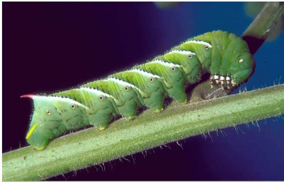
LES CHENILLES DU PAPILLON MANDUCA QUINQUEMACULATA sont vertes par temps chaud, lorsque la végétation est abondante, et noires sinon. Une équipe américaine a reproduit cette plasticité chez des chenilles d'une espèce voisine.